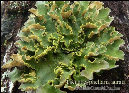
Pseudocyphellaria aurata