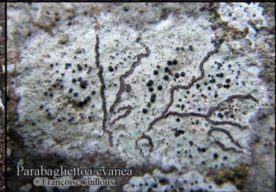
Parabagliettoa cyanea