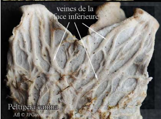
Peltigera canina Afl