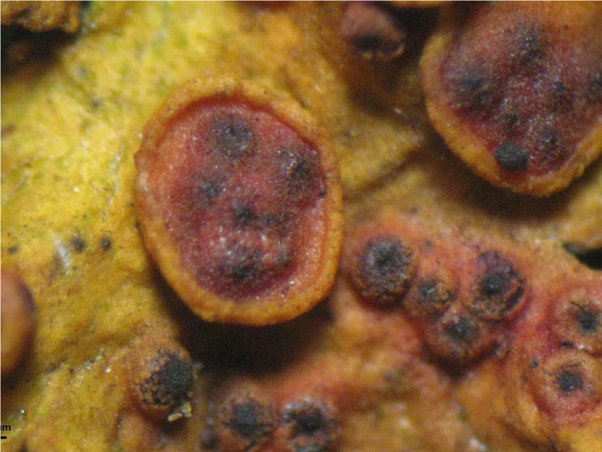
Fig. 1. Thalle de Xanthoria parietina parasité par Polycoccum slaptoniense dont les périthèces sont immergés dans les apothécies ou le thalle