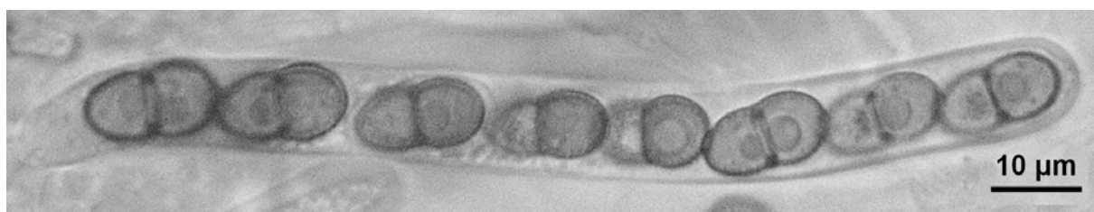
Fig. 3. Asque octosporé

La description que nous donnons de Polycoccum slaptoniense est très semblable à la diagnose originale (HAWKSWORTH, 1994), les observations sur notre récolte étant parfaitement en accord avec celle-ci, ce qui traduit probablement une faible variabilité intraspécifique. Cette description originale étant illustrée de dessins en noir et blanc, il nous a semblé important, à l'ère du numérique, de présenter des illustrations photographiques des caractères déterminants. Enfin, P. slaptoniense n'est pas le seul Polycoccum présent dans le thalle ou les apothécies de lichens. Dans le but d'inciter le lecteur à chercher et observer ces pyrénomycètes, nous vous proposons ci-après une clé actualisée commentée du genre Polycoccum en France.